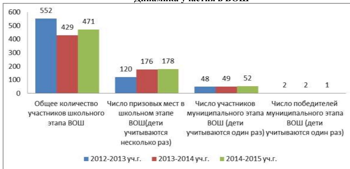
Динамика участия в ВОШ

В динамике участия в ВОШ прослеживается увеличение количества участников школьного и муниципального уровня, увеличение победителей школьного уровня, а победителей муниципального уровня становится меньше. Это связано в первую очередь с тем, что одни и те же ребята стараются попробовать себя в олимпиадах по разным предметам на школьном уровне, а готовясь к олимпиаде муниципального уровня отдают приоритет одному из предметов.