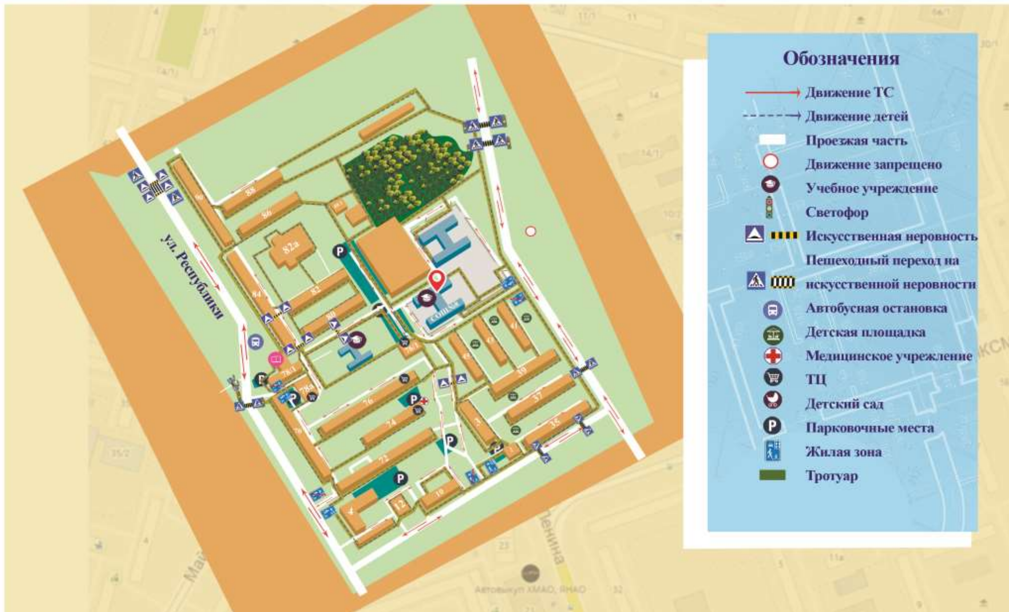
Схема дорожной безопасности МБОУ СОШ №8 имени Сибирцева А.Н.